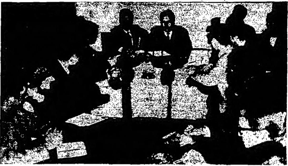
سمو الامير حسن يتحدث الى وفد معهد الدراسات الدولية

ولكن البيت الأبيض ان من غير المر ان يوجه المستر افريل هاريمان والمستر لوين موسون مع الرئيس جونسون الى هاواي . ويتظن ان يجتمع الرئيس امريكي